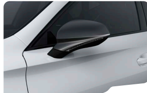
BLANCO NEVADA FORMENTOR