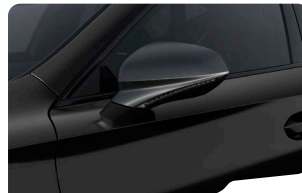
NEGRO MIDNIGHT FORMENTOR