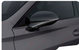
GRIS GRAFENO FORMENTOR