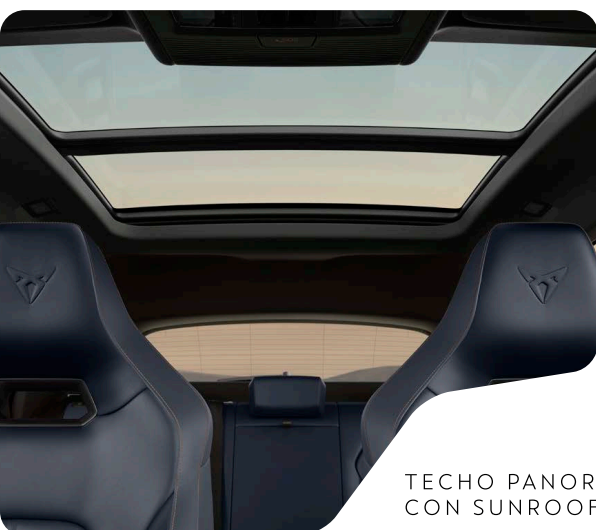
TECHO PANORÁMICO CON SUNROOF