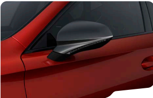
ROJO DESIRE FORMENTOR