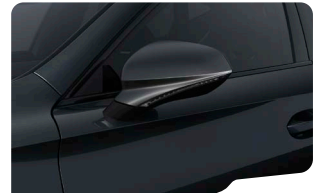
GRIS MAGNETICH FORMENTOR